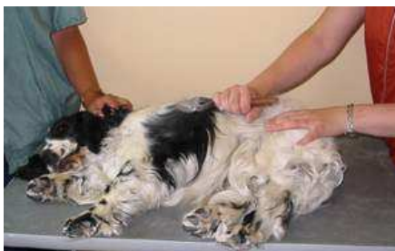
Ein gut erzogener Hund lässt sich geduldig auf die Seite legen.

entfernen. Ist die Jacke aber wollig und lang, pudere ich den Hund zunächst mit Kreidepuder ein. Das Trimmen mit dem Trimmstriegel ist so bedeutend leichter, denn die Haare werden griffiger. Der gesamte Rücken (seitlich bis auf die Höhe der Ellenbogengelenke und hinten bis in die Oberschenkel hinein) wird so lange bearbeitet, bis das Haarkleid schön glatt anliegt.