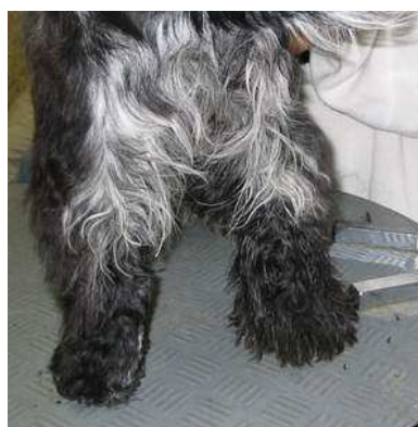
Die Fotos zeigen jeweils eine fertige und eine noch nicht bearbeitete Pfote.